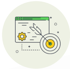
コンサルティング