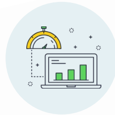
パフォーマンス改善